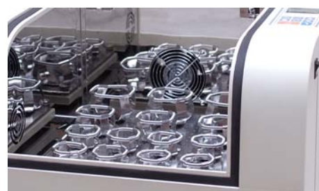
[03] Visualización de las muestras desde el exterior. Visualization of the samples from the outside.