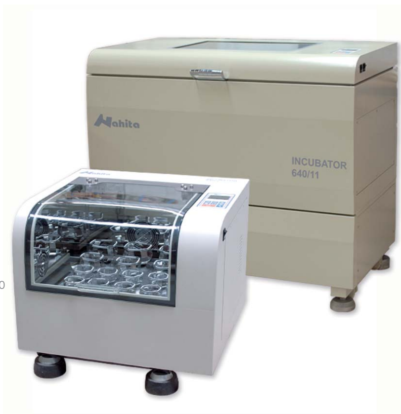
[01] Referencia: 50640010 Code: 50640010