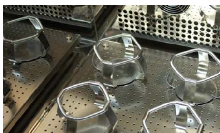
[02] Adaptadores, permiten que cada usuario configure las cámaras según sus necesidades. The holders allows the user making up the incubators according to their own necessities.