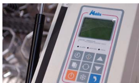
[01] Display para el control de la velocidad, temperatura y tiempo. Display to programm the operation speed, temperature and time