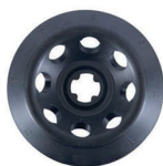
Cabezal angular | GDF007 1.5/2 mL x 8 4000 rpm/990 xg 7000 rpm/2910 xg 10000 rpm/5610 xg