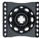
Cabezal angular | GDF013 1.5 mL x 6 + 0.5 mL x 6 + 0.2 mL x 8 x 2 4000 rpm/912 xg 7000 rpm/2793 xg 10000 rpm/5701 xg