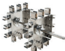
Tipo asador, horizontal Referencia LJJ002 Para 24 tubos de 1,5 mL