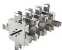
Tipo asador, vertical Referencia LJJ006* Para 16 tubos de 50 mL * incluida con el equipo