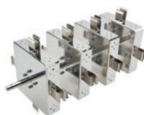
Tipo asador, vertical Referencia LJJ005 Para 16 tubos de 15 mL