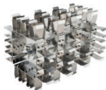
Tipo asador, horizontal Referencia LJJ003 Para 24 tubos de 50 mL