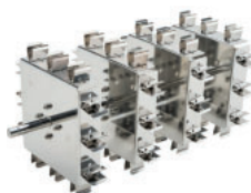
Tipo asador, horizontal Referencia LJJ001 Para 48 tubos de 1,5 mL