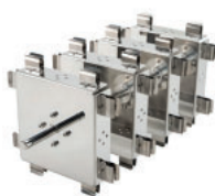
Tipo asador, vertical Referencia LJJ004 Para 32 tubos de 1,5 mL