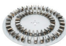
Tipo disco Referencia LJJ007 Para 60 tubos de 1,5 mL