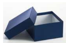
Cajas de cartón según medidas 50, 75 y 100 mm. alto.