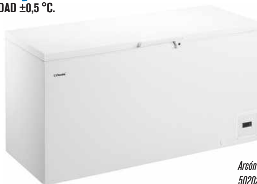
Arcón LAB-51 5020203