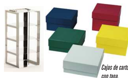
Cajas de cartón con tapa.