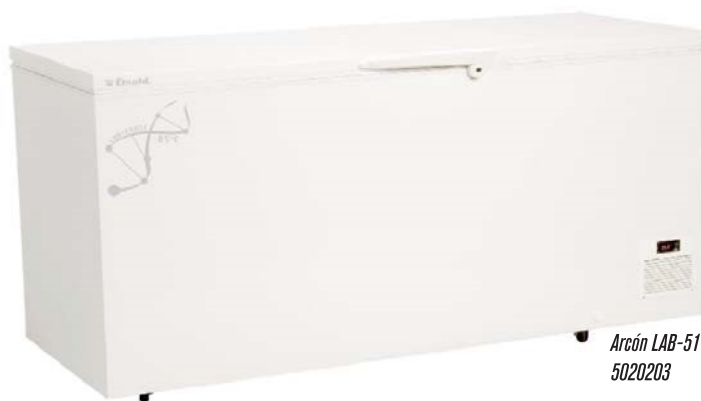
Arcón LAB-51 5020203