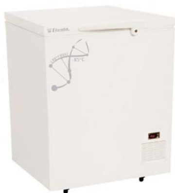
Arcón LAB-11 Código 5020202

PARA TEMPERATURAS REGULABLES DESDE -60 °C. A -85 °C. ESTABILIDAD \pm 0,5 °C.