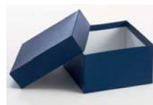
Cajas de cartón según medidas 50, 75 y 100 mm. alto.